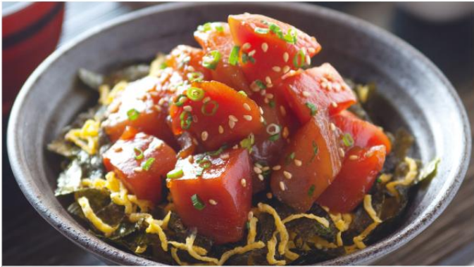
とろ家名物 ぶつ切りまぐろ丼 厳選したまぐろのぶつ切りを使用したとろ家の名物丼