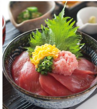
ネギとろ鉄火丼 ¥870 まぐろの赤身とネギとろを使用した定番丼