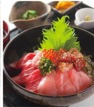
「極~KIWAMI」まぐろづくし丼 ¥1,550 まぐろの赤身、中とろ、大とろを使用した至極のまぐろづくし丼