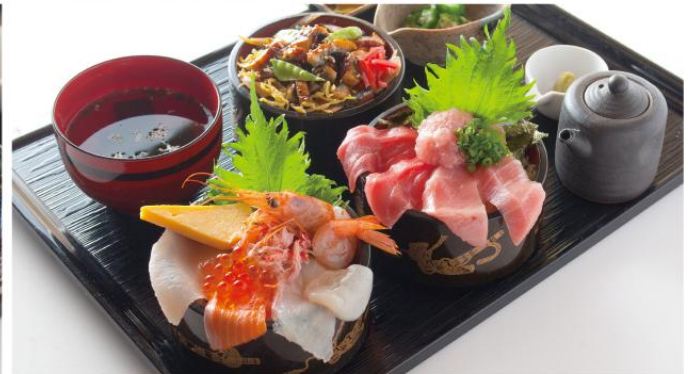
特撰三種の海鮮丼 ~とろ家の彩り膳~ ¥1,980 (小税) まぐろづくし丼、海鮮づくし丼、鰻丼を一度に楽しめる、とろ家の豪華膳