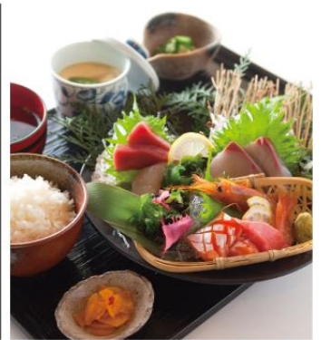
旬魚のお刺身定食 ¥1,450 朝引き旬魚、まぐろの「中とろ」を使用したお刺身定食