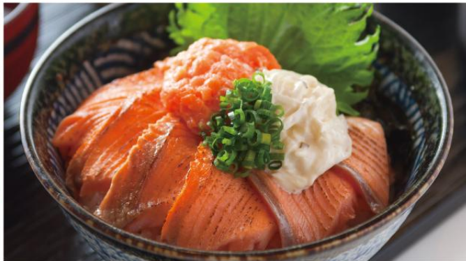
サーモン二種炙り丼 ¥950 (小税) 脂ののったサーモンをさっと炙り、香ばしく旨みたっぷりの炙り丼