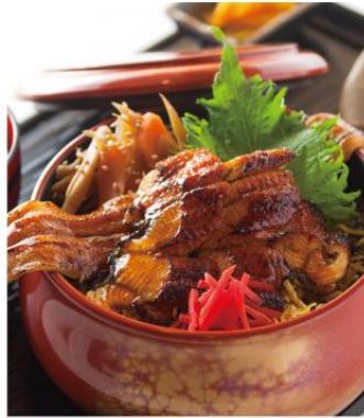
鰻と穴子の合盛炙り丼 ¥1,450 脂ののった鰻と淡白な旨みを持つ穴子の蒲焼仕立ての丼