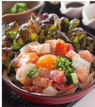
七種の海鮮ユッケ丼 ¥950 七種類の海鮮と生野菜を組み合わせたとろ家のユッケ丼