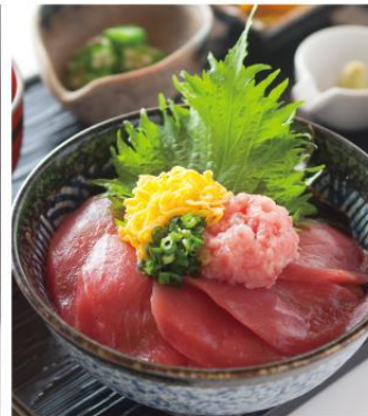
ネギとろ鉄火丼 ¥870 まぐろの赤身とネギとろを使用した定番丼