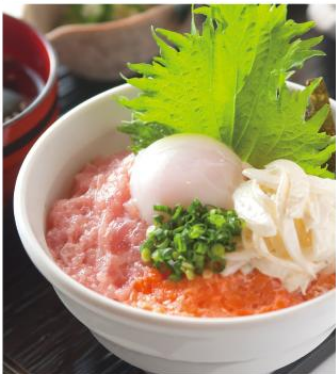
まぐろとサーモンのたたき丼 ¥870 まぐろの「ネギとろ」、サーモンの「しゃけとろ」を使用した合盛丼