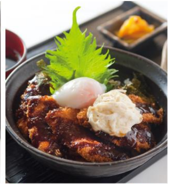
まぐろソースカツ丼 ¥870 まぐろの一口カツと自家製ソースを使用したボリューム満点丼