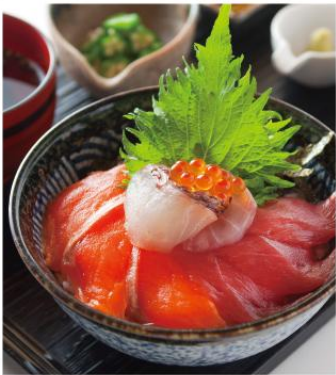
季節の三色海鮮丼 ¥950 人気ネタのまぐろの赤身、サーモン、季節の鮮魚を使用した三色丼