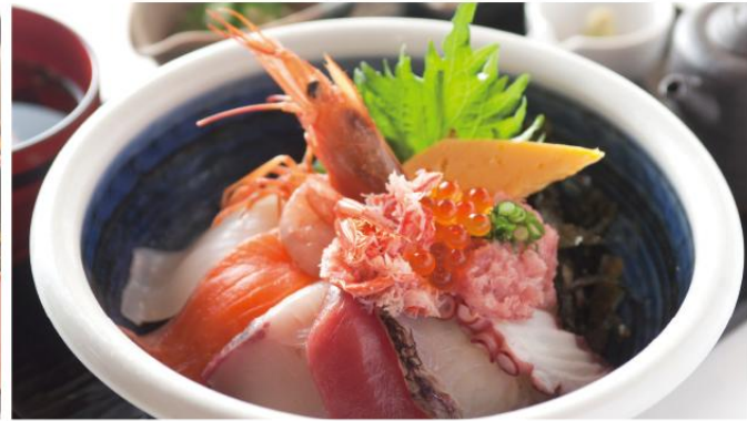
荒波海鮮丼 十種類の鮮魚を使用した豪華絢爛盛り込み丼